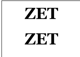
Père de Carmen