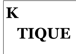
Avec des hauts et des bas