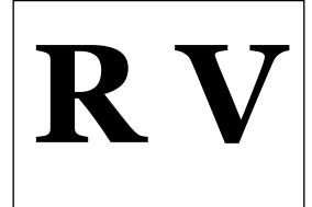
Prénom masculin (On ne pouvait pas ne pas le faire)