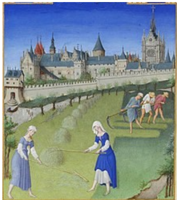
A la recherche du top (extrait d'une miniature du XV e s). Tournoi homologable du Duc de Berry (musée du Scrabble).